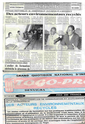
Publication des activités de ADT-Togo dans la presse