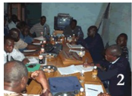
Photo 2 : Séance de travail entre la délégation togolaise et des acteurs maliens concernés par le dossier