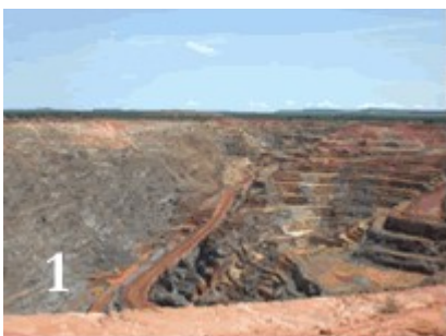
Visite d'échange au Mali

Le projet a permis aux communautés riveraines d'être davantage sensibilisées sur les tenants et aboutissants du projet d'exploitation de bauxite dans le mont Agou, de même que sur la conduite à tenir dans la lutte contre cette exploitation et/ou pour l'opérationnalisation de l'étude impact environnemental du projet d'exploitation de bauxite.