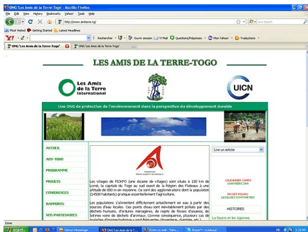
Nouveau design du site web de ADT-Togo