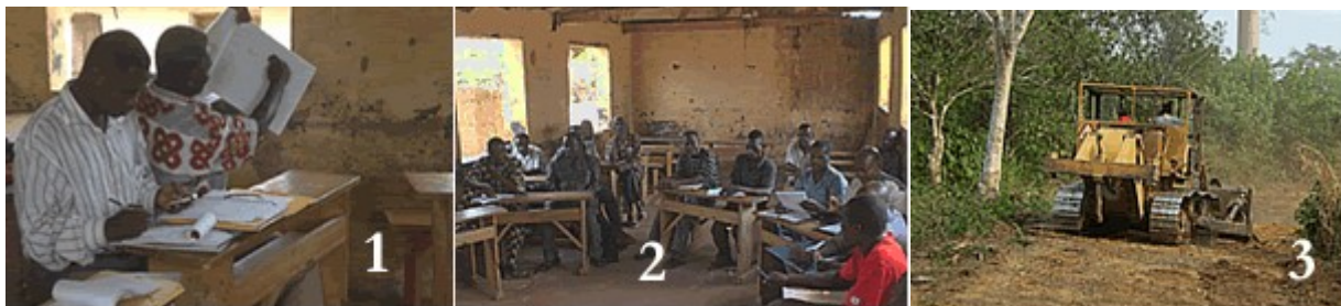
Photos 1 et 2 : séance d'échanges sur le projet entre le staff de ADT-Togo et les membres des CVD du canton de Fiokpo