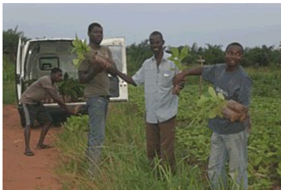
Des volontaires chargent le véhicule de jeunes plants pour le reboisement de parcelles communautaires