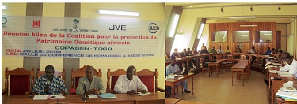
Participants à la réunion bilan de la Coalition pour la protection du Patrimoine Génétique

L'objectif de ces activités est de faire le suivi des actions de la Coalition.