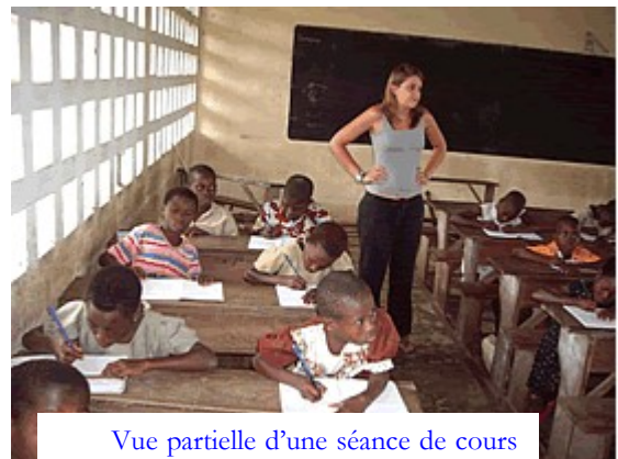
Vue partielle d'une séance de cours d'appui à des élèves