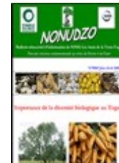
Exemplaire de bulletin d'information NONUDZO