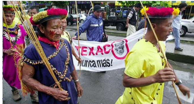
Manifestation contre Texaco

équatorienne en estimant que « les plaignants ont utilisé des méthodes mafieuses pour soutirer de l'argent à une entreprise très riche » 42 .