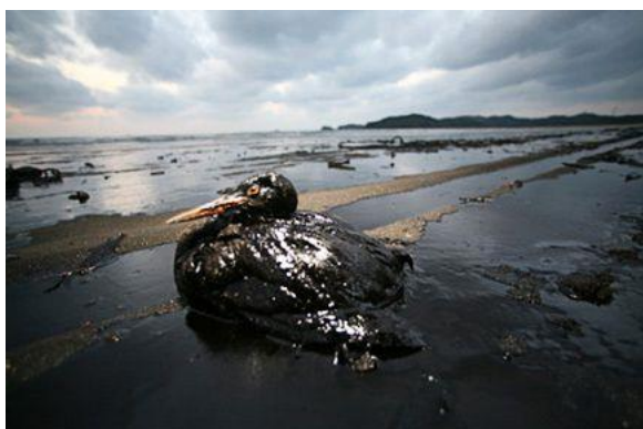
Oiseau marin hibernant dans le Golfe de Gascogne, victime de rejet de pétrole

Bien plus, en émettant du dioxyde de carbone (CO 2 ) durant leur cycle de vie, les combustibles fossiles, contribuent au réchauffement climatique.