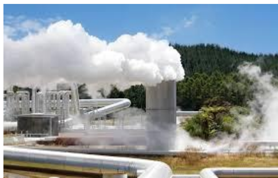
Infrastructure d'exploitation de l'énergie géothermique, en Turquie

Le forage peut provoquer des affaissements de terrain. La géothermie peut parfois dégager de faibles vapeurs de soufre si elle est utilisée sous la forme d'eau ou de chaleur. La géothermie n'est pas une énergie 100 % renouvelable car elle nécessite un générateur, donc de l'électricité. Certaines pompes à chaleur utilisent également du fréon : seuls certains fluides « verts » sont autorisés.