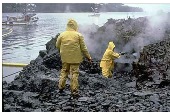
Utilisation d'un lavage à haute pression et à l'eau chaude pour nettoyer un rivage mazouté. Plages du Prince William Sound, Etat d'Alaska aux Etats-Unis.

http://tpehmzpetrole20142015.over-blog.com/2014/12/les-impacts-environnementaux-du-petrole.html