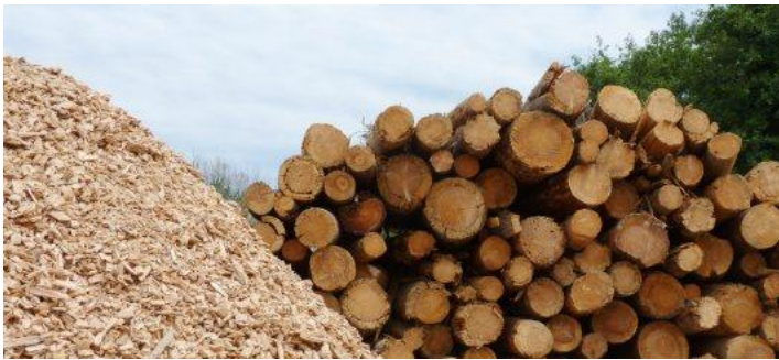
Bois et résidus de bois

La biomasse est réputée génératrice de CO 2 , et donc polluante, ce qui constitue un inconvénient majeur pour l'énergie de la biomasse. En réalité, la quantité de dioxyde de carbone qu'elle rejette correspond à la quantité de CO 2 qui est précédemment absorbée par les végétaux qui sont ensuite utilisés comme ressource énergétique. C'est donc un cycle sans fin qui se produit.