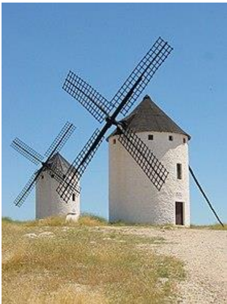
Moulins dans la région de La Mancha, en Espagne