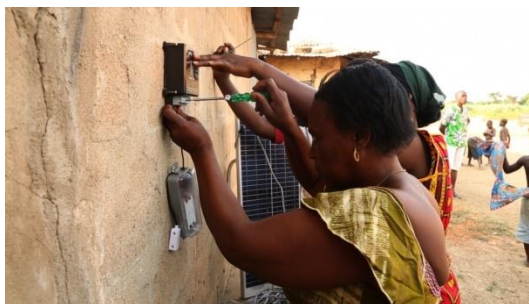
Ingénieures formées dans le cadre du projet, électrifiant un ménage par énergie solaire