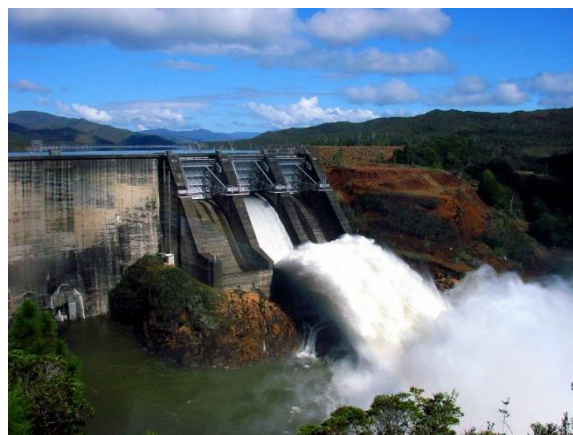
Barrage de Nangbeto, au Togo

A la phase de construction du barrage, des débris divers peuvent polluer l'eau.